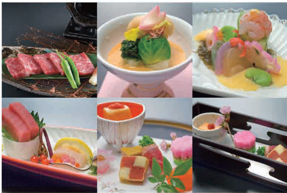
🐼 お料理の写真はイメージです。季節や宿泊プランによって異なります。

季節の旬の素材を香ばしく いただく“名物”炭火会席は、 舌鼓を打ちながら、思わず 笑顔がこぼれる宴席で ございます。 縁起尽くしの宿ならではの “めでたい演出”とともに、 日光の味覚を思う存分 にお楽しみください。