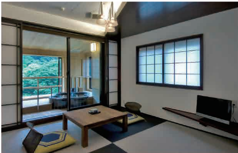
和モダン調のリビングと琉球畳の和室