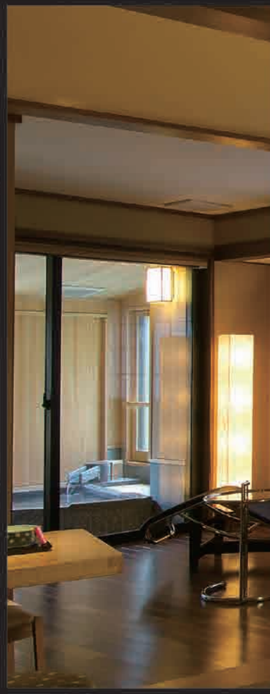
🐼 長生きの間「末広がり」