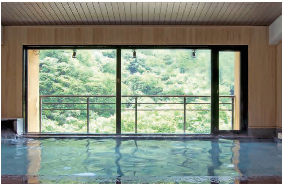
殿方大浴場 もりもりの湯「万年美男」

四季を通して 情緒ゆたかな風呂 新緑が芽吹く春。 爽やかな風が抜ける夏。 山々が輝きはなつ秋。 しんしんと静寂な冬。 折々の情緒がココロまで やさしく温めます。