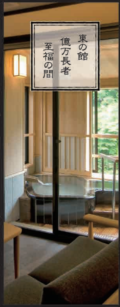
🐼 金運の間「大判小判」