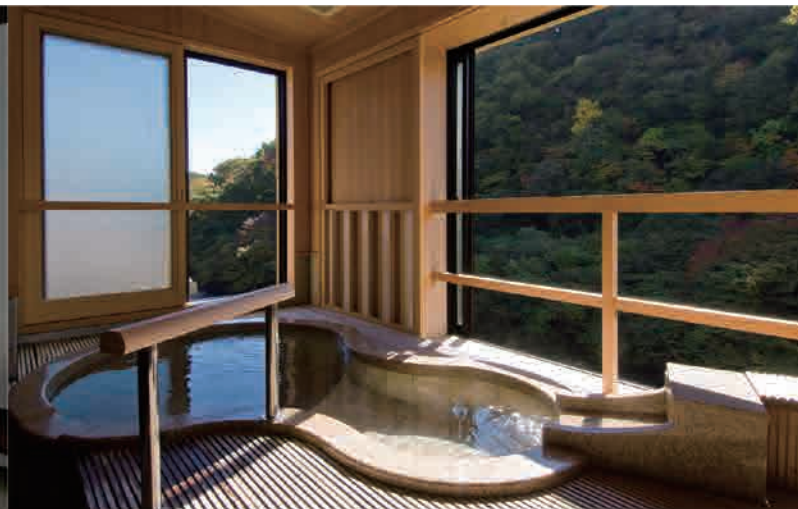
板敷の居間と数寄屋造りの和室