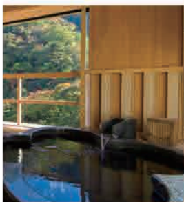
“四葉のクローバー”の露天風呂