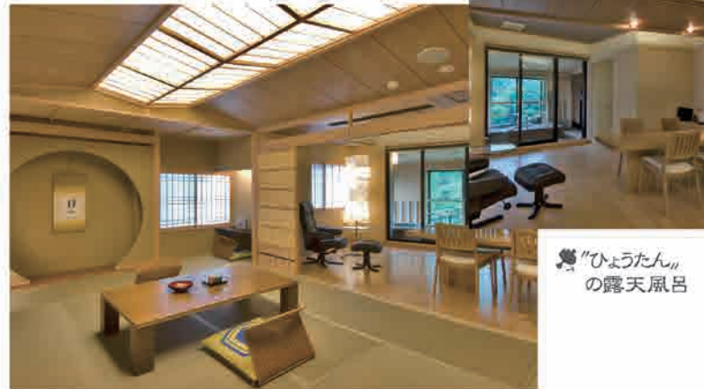
“ひょうたん”の露天風呂