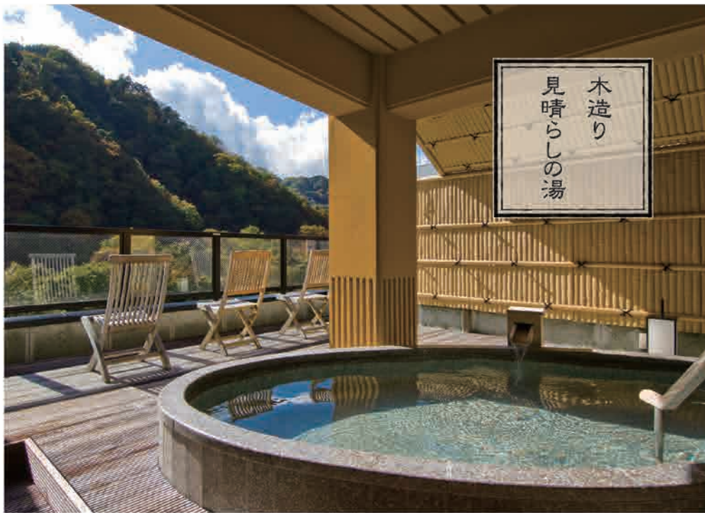
ご婦人露天風呂「千風」

日光の自然の息吹が宿る “見晴らしの湯” 四季折々に彩られる山々。 途切れることのない川のせせらぎ。 優しくそよぐ風。 日光の自然の息吹を感じながら 浸かる湯は、他で味わえない “ありがたい湯”として、縁起 の良さを実感していただける ものとなります。