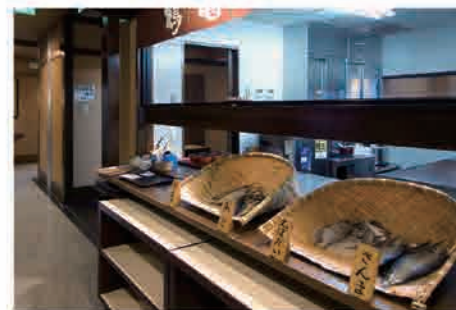
🐼 お好きな魚が選べる焼き魚コーナー(朝食)