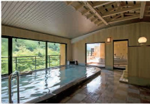
ご婦人大浴場 つるつるの湯「千年美人」

日光の自然の息吹が宿る “見晴らしの湯” 四季折々に彩られる山々。 途切れることのない川のせせらぎ。 優しくそよぐ風。 日光の自然の息吹を感じながら 浸かる湯は、他で味わえない “ありがたい湯”として、縁起 の良さを実感していただける ものとなります。