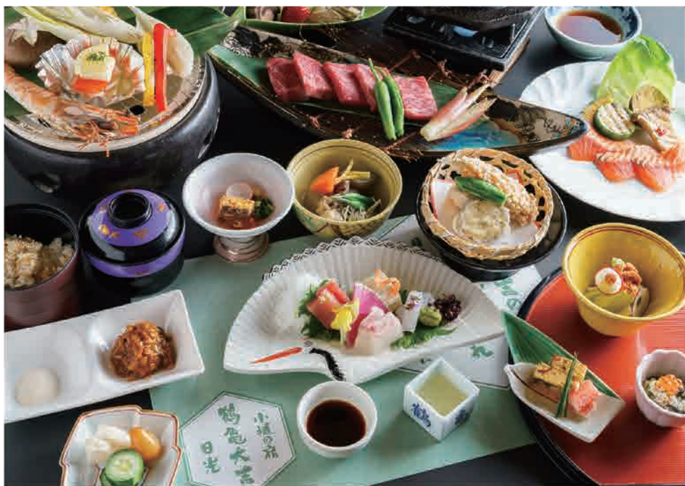
🐼 味わい深い炭火会席は、彩りゆたかに“幸せ”もお届けいたします。