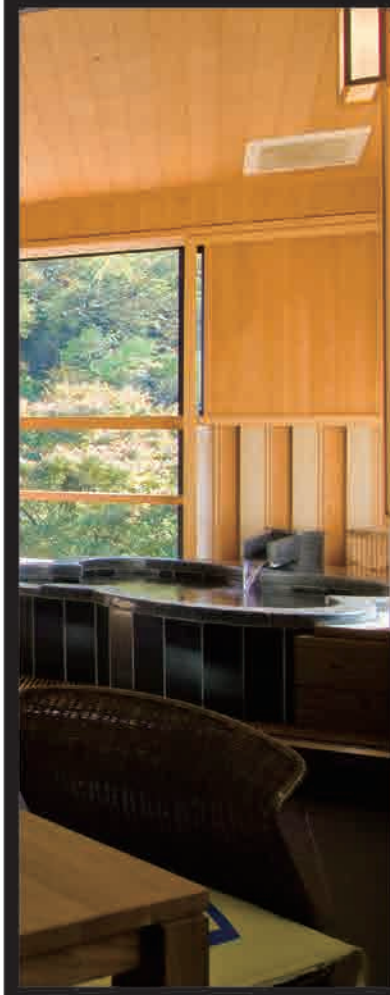
🐼 幸福の間「ここに幸あり」