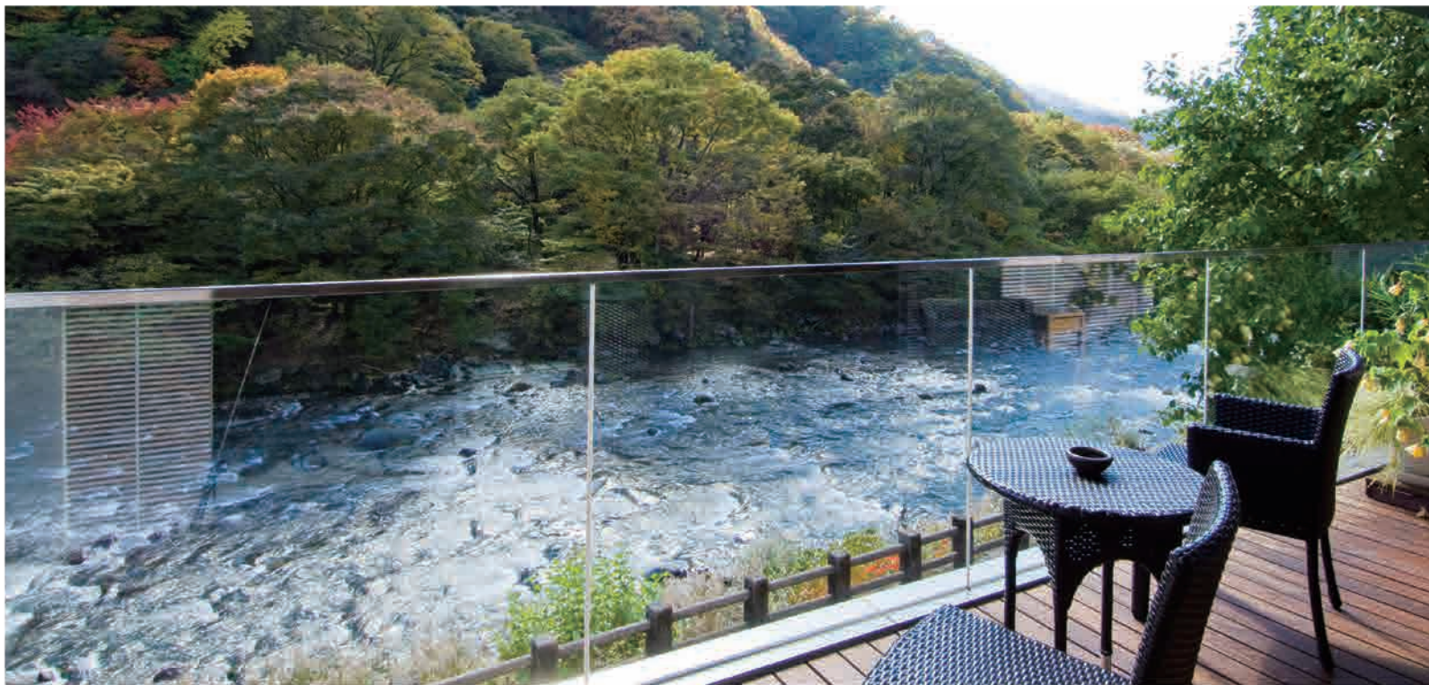
「福待ち処」テラスからの眺め