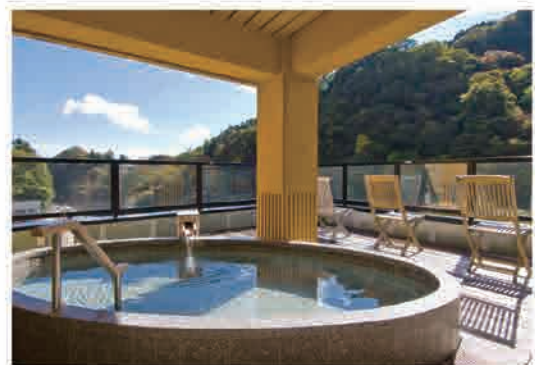
殿方露天風呂「万風」